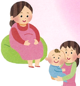
産前産後の手伝い