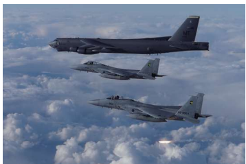
核搭載可能なB52H戦略爆撃機と自衛隊F-15戦闘機との日米共同訓練

石破政権もこの路線をそのまま推進しています。石破首相は国是である非核三原則(核兵器を持たず、作らず、持ち込ませず)を見直し、「核共有」を柱とする「アジア版NATO」創設を主張しています。2025年度予算で過去最高の8兆7千億円もの防衛費(軍事費)を計上しました。