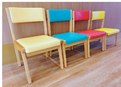
ご利用者にあった椅子に座ります。床に足を付けて座ることで下肢の筋力がアップします。