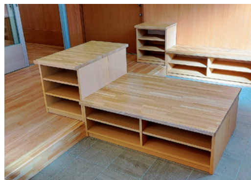
玄関は機能訓練として15cmの段差を設けます。

営業時間 24 時間 365 日営業 利用形態 登録制 / 定員 29 名 通い 18 名 / 日 泊まり 8 名 / 日 利用対象 豊橋在住で要介護認定された方