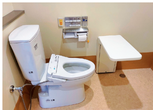
トイレはファンレストテーブルを設置し、安心してゆっくり排泄できます。